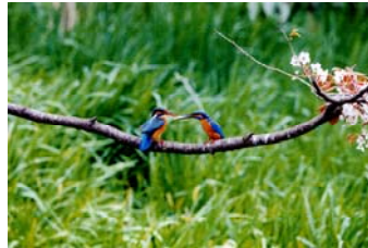
武蔵関公園のカワセミ (関町北三丁目)