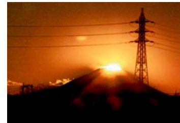
もみじ山公園から見える富士山 (大泉町一丁目)