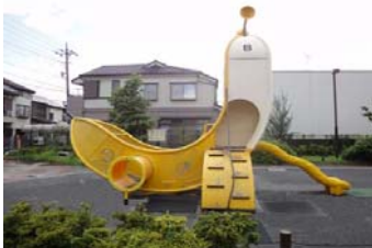
ばなな公園 (田柄五丁目)