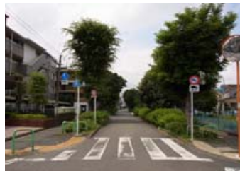
田柄川緑道 (田柄二丁目)