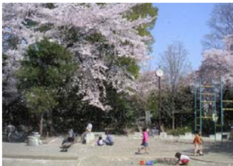
徳田公園の桜吹雪 (豊玉南一丁目)