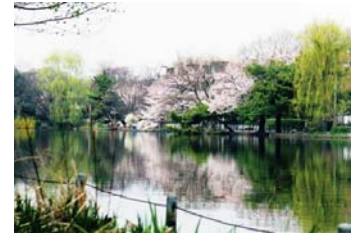
石神井池の水面 (石神井町五丁目)