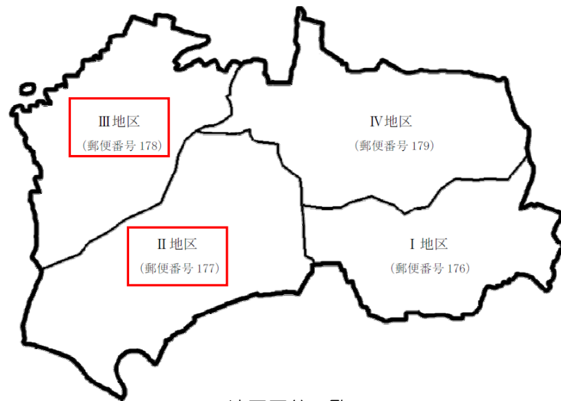
地区区分別回収状況