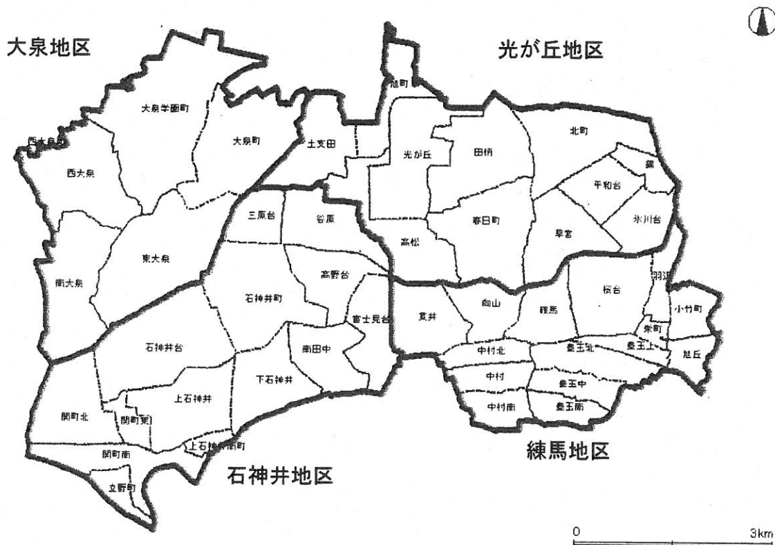
<総合福祉事務所管轄単位の区域設定イメージ図>

総合福祉事務所管轄単位の区域設定のイメージ図および事業ごとの教育・保育提供区域については以下のとおりです。