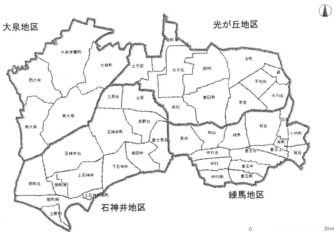
＜総合福祉事務所管轄単位の区域設定イメージ図＞

総合福祉事務所管轄単位の区域設定のイメージ図および事業ごとの教育・保育提供区域については以下のとおりです。