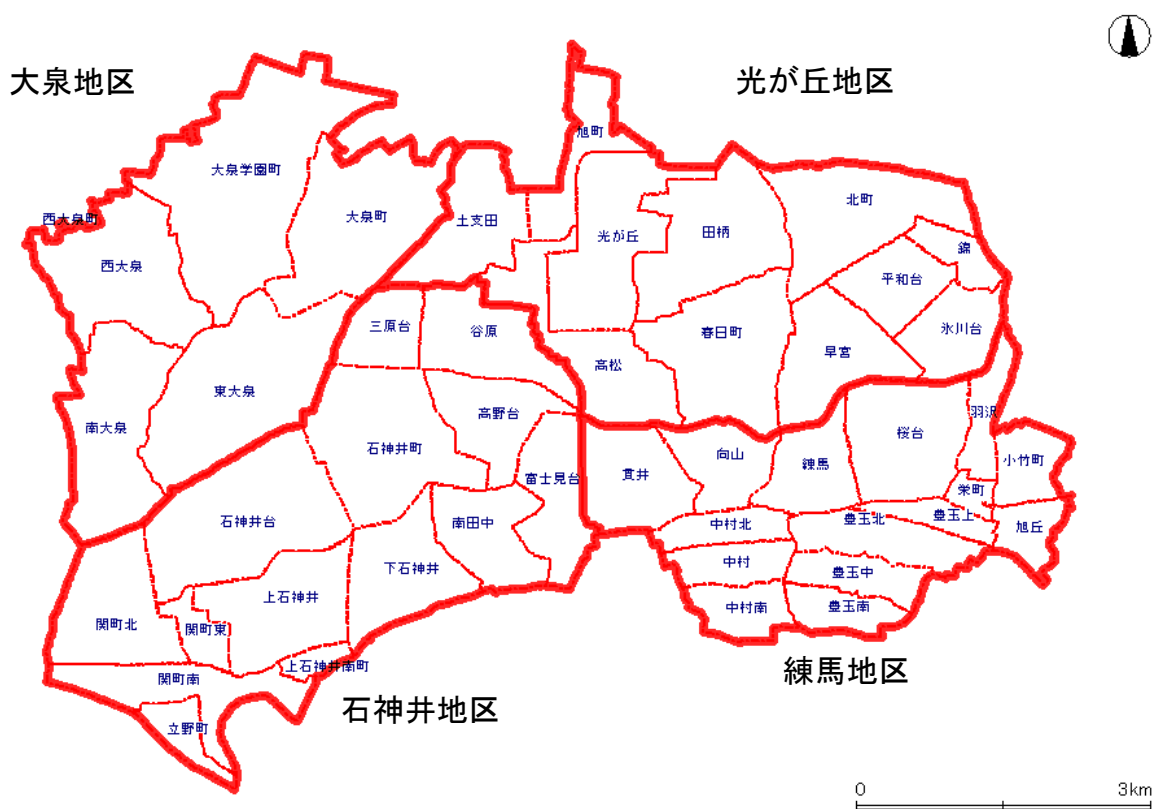
＜総合福祉事務所管轄単位の区域設定イメージ図＞

総合福祉事務所管轄単位の区域設定のイメージ図および事業ごとの教育・保育提供区域については以下のとおりです。