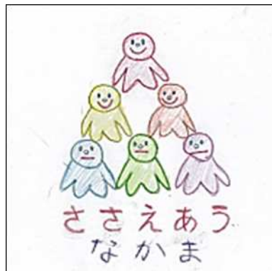
【小学校 4 ・ 5 ・ 6 年生の部】