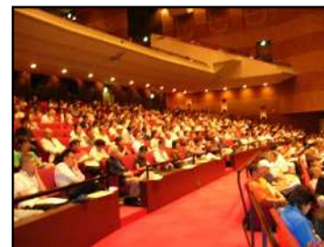
食品衛生実務講習会

食品衛生責任者を主な対象とし、自主的な衛生管理の推進に関する事項や最新の食品衛生に関する知識を提供するため、食品衛生実務講習会を実施します。