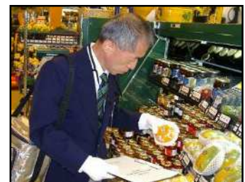
店頭での監視の様子

また、新たに成立した食品表示法は、食品衛生法をはじめJAS法や健康増進法などの法令が移行する部分もあり、施行に向けて情報収集し、準備を進め、各関係機関と連携協力して適正表示の推進に努めます。