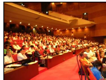
食品衛生実務講習会

すし店、食肉販売店といった業態ごとの営業者・食品衛生責任者 *4 を対象に、それぞれの業態の特性を踏まえた衛生管理について、食品衛生講習会を実施します。