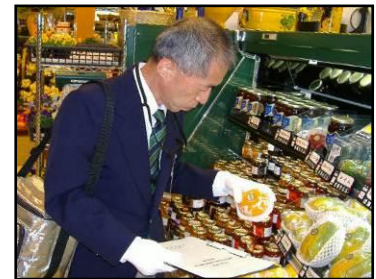
店頭での監視の様子

食品衛生法に基づく適正表示の徹底を図ります。また、JAS法や健康増進法、薬事法などの表示についても、関係機関と連携協力して適正表示の推進に努めます。