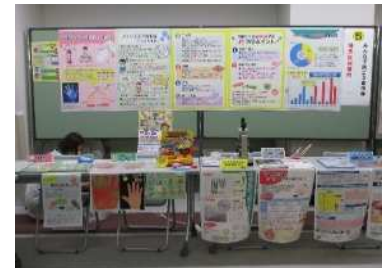
「消費生活展ねりま」への参加