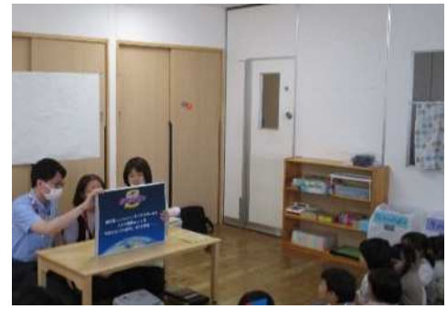
「食の安全教室（手洗い教室）」の様子