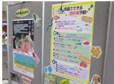
「くらしのフェアパネル展」への参加

区民の食品衛生意識の向上のため、要望に応じて食品衛生出前講習会を実施し、食品衛生に係る情報を提供します。また、庁内他部署の実施するイベントに出展し、来場する消費者に対して積極的に食品衛生知識の普及啓発を行い、食品による健康被害発生の防止に努めます。