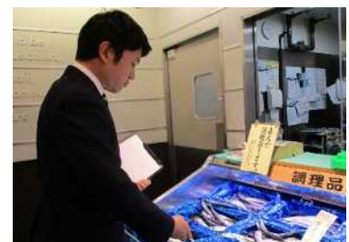
店頭での監視の様子