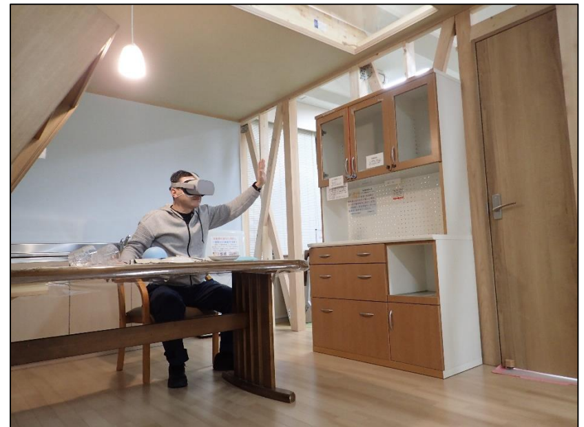
防災学習センターのVR地震体験（発災体験ツアー）