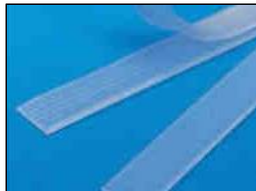
「防火防災診断」で周知している家具転倒防止器具の例