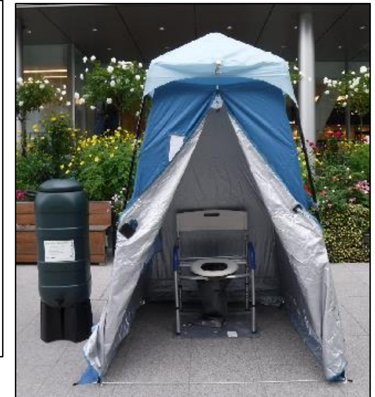
マンションの取組により導入されたマンホールトイレの例（横浜市）