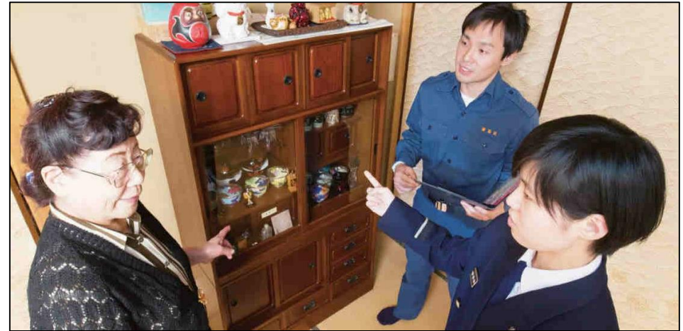
区と消防が連携して実施する「防火防災診断」の様子（イメージ）