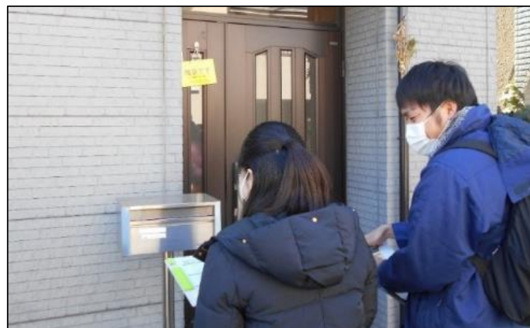
避難行動要支援者宅の安否確認の様子（イメージ）