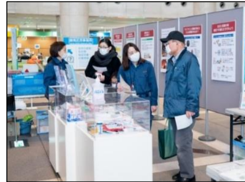
防災企画展（区役所アトリウム）での防災用品の啓発