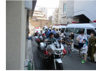
警察署での白バイ乗車体験