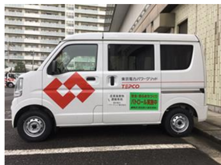
パトロールプレートを装着した 協定団体の業務車両