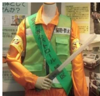
配付している パトロール用品の一例