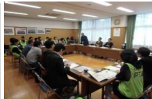
大泉第一小学校（あんしん大一） 地域防犯防火連携組織連絡会