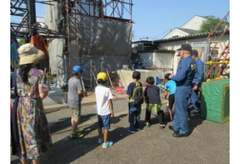
消防署での初期消火体験