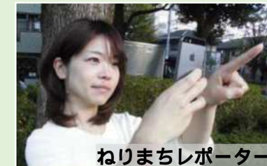
ねりまちレポーター