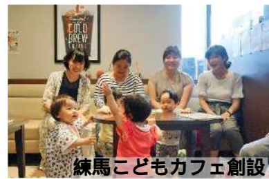
練馬こどもカフェ創設