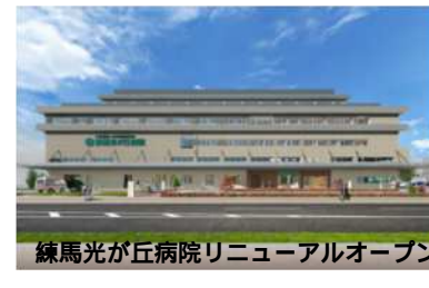
練馬光が丘病院リニューアルオープン