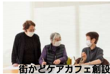
街かどケアカフェ創設