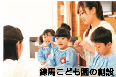
練馬こども園の創設