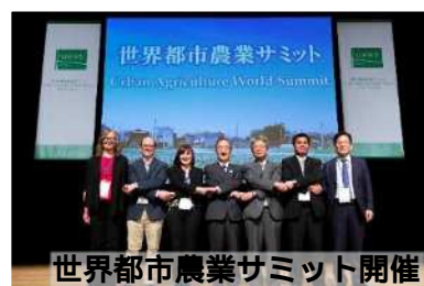
世界都市農業サミット開催