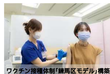
ワクチン接種体制「練馬区モデル」構築