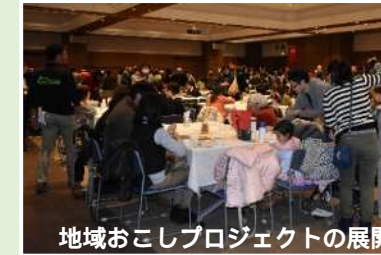
地域おこしプロジェクトの展開