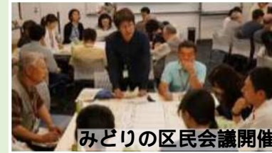
みどりの区民会議開催

政策を実現するための 具体的な仕組みや態勢を「区民の視点」から見直す 様々な改革を実行