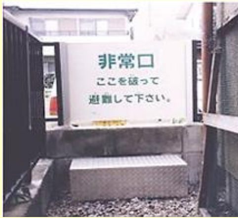
蹴破り戸を設置した事例