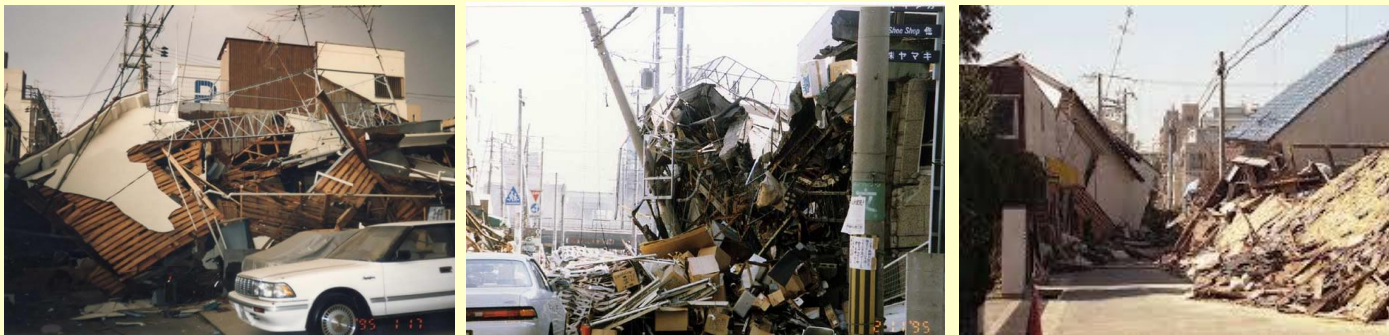
阪神・淡路大震災により建物が倒壊して道路が塞がってしまった事例

区内には、多くの行き止まり道路があります。1方向の避難路では、その方向の道路が塞がれてしまうと避難できなくなるため、もう一方に緊急時に使える非常用通路を確保することで、2方向への避難を可能にすることにより「災害に強い安全なまちづくり」を進めていきます。