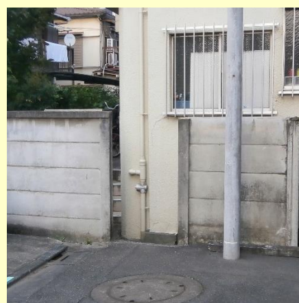
ブロック塀を撤去して通路を確保した事例