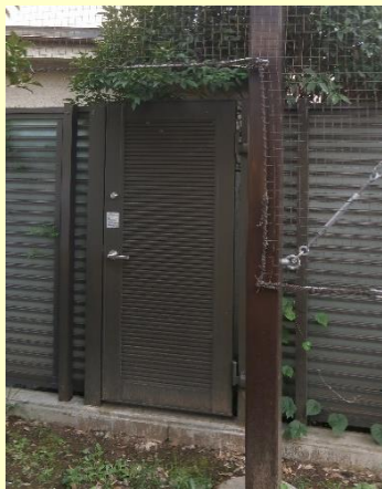
門扉を設置した事例