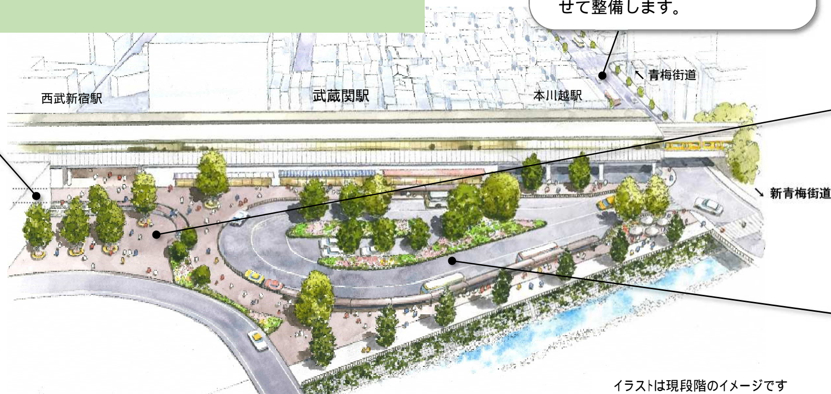
イラストは現段階のイメージです