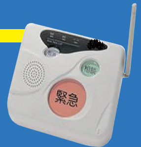
「緊急通報システム」

⚠ 区が入居者の身元を保証するものではありません。利用者と貸主による賃貸借契約になります。