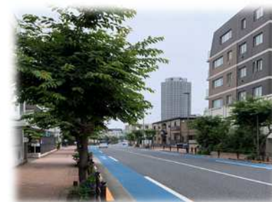
整備後のイメージ （補助132号線：石神井町2丁目付近）