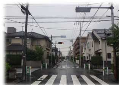
整備前 （関町北2丁目付近）