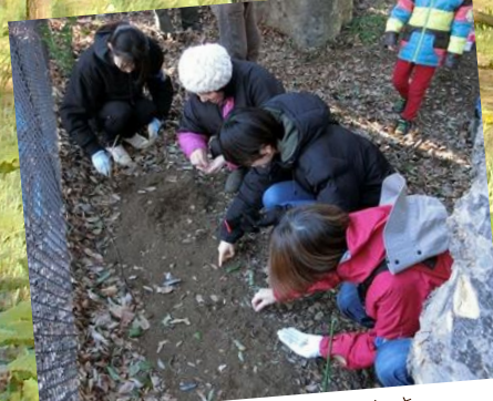
ウラシマソウ種まき