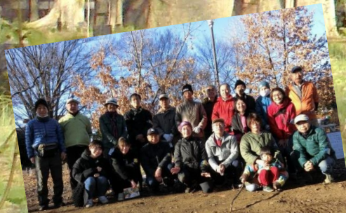
ファンクラブのメンバー達

★7～9月は9：30～11：30に活動する予定です。大丈夫です。ご都合のよい時にご参加ください。