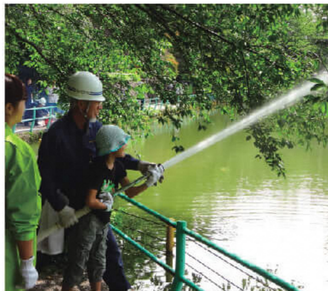
火災時を想定した消火訓練