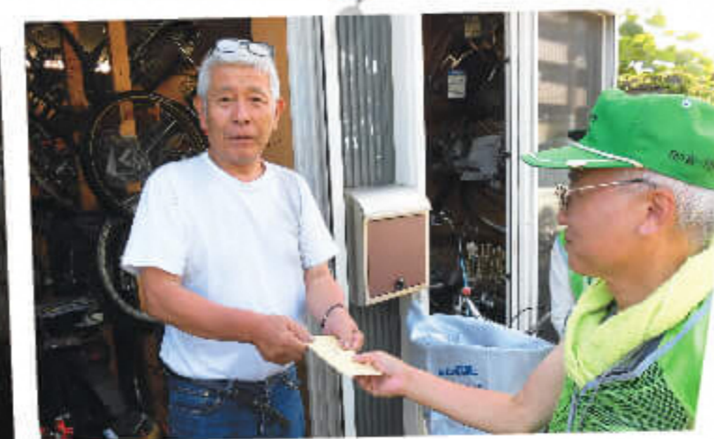
声を掛けてもらって、 温かい気持ちになった