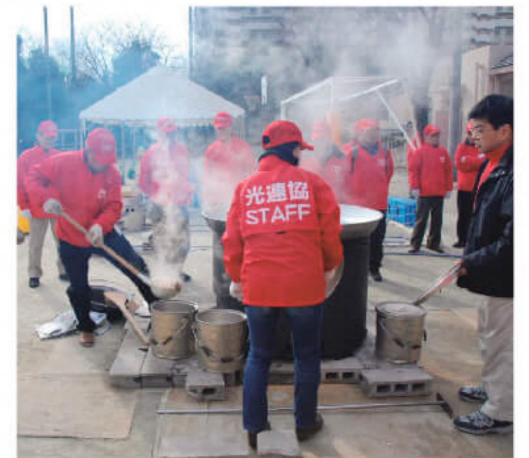
避難生活を想定した炊き出し訓練

お住まいの地域の町会・自治会がわからない、もっと詳しい情報を知りたいなどありましたら お気軽にお問い合わせください