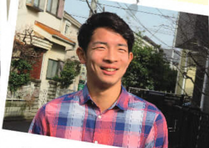
職場以外のつながりができた