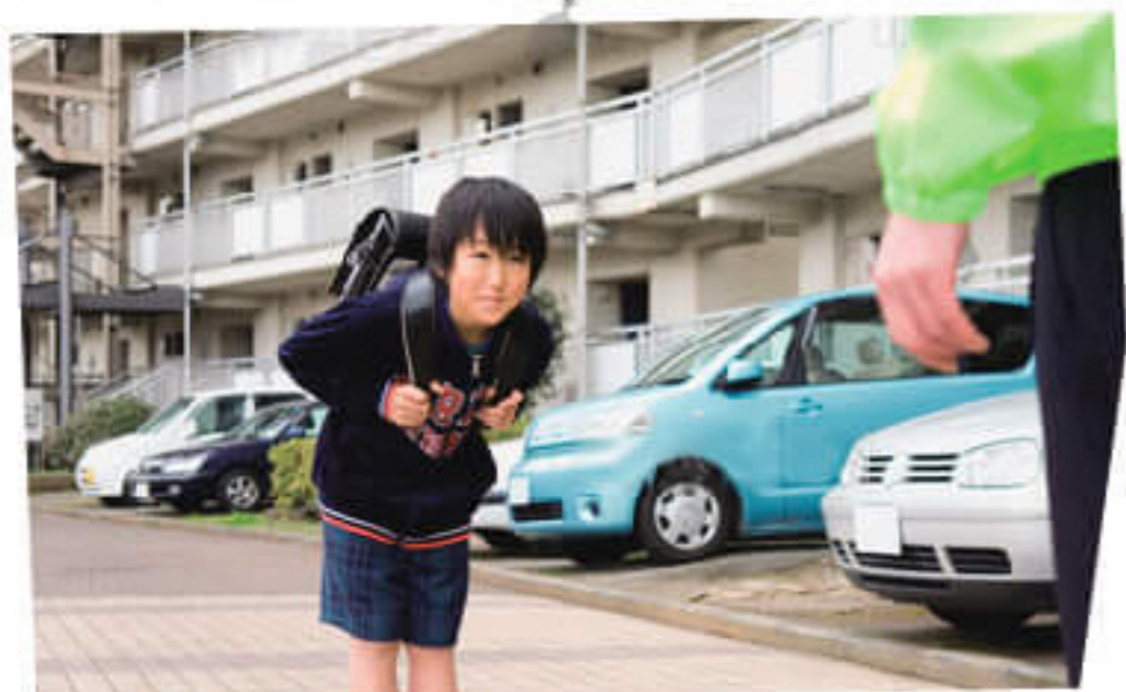
うちの子が近所の人に あいさつするようになった