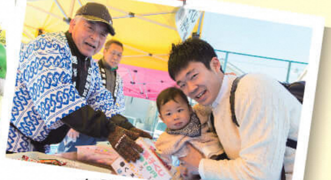
お祭りに参加して また1つ家族との思い出が増えた