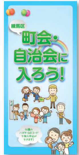
加入案内リーフレット

📞 窓口 練馬区町会連合会事務局(地域振興課 地域コミュニティ支援係) 電話番号:5984-1039(直通)