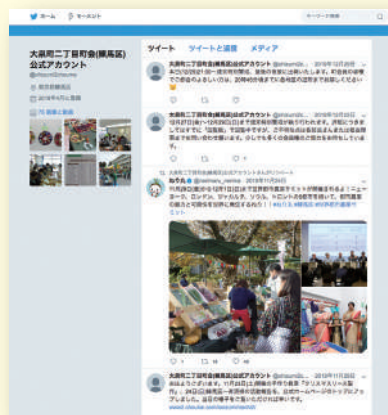
大泉町二丁目町会

TwitterやFacebookなどのSNSは、パソコンなどがなくてもスマートフォンなどで更新することができるため、比較的容易に町会・自治会の情報を発信することができます。また、②同様にリアルタイムで情報を更新することができます。