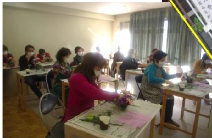
フラワーアレンジメント