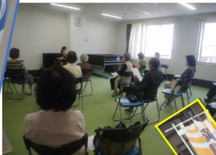
アコーディオン演奏会