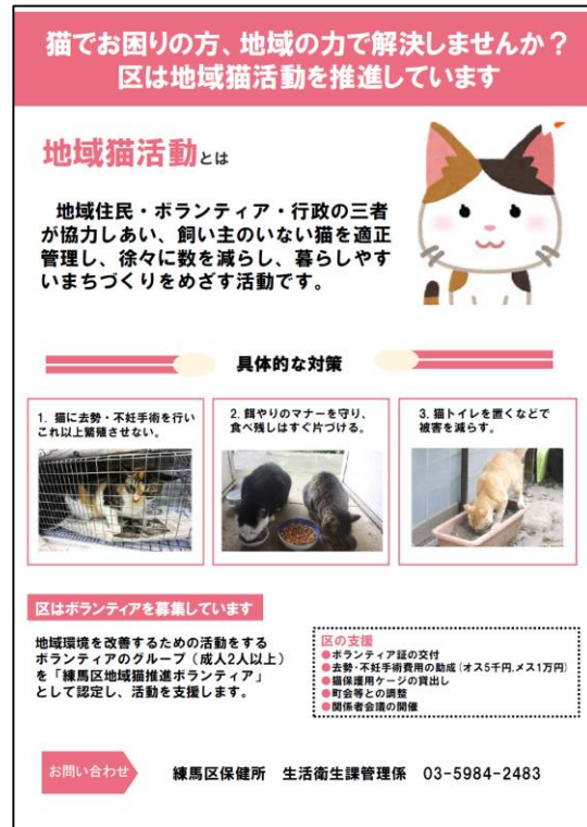
「地域猫活動とは」(練馬区保健所作成)