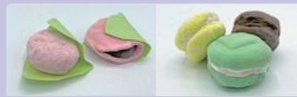
作った作品は持ち帰りすることができます。