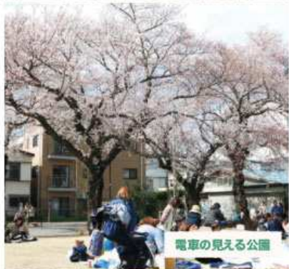
電車の見える公園