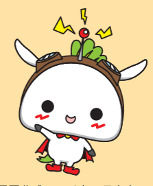
練馬区公式アニメキャラクター ねり丸 ©練馬区 Nerima's official anime character: Nerimaru ©Nerima City 练马区官方指定动画 吉祥物练丸马路 ©练马区