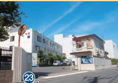
23 東映東京撮影所 Toei Tokyo Studios 东映东京摄影基地