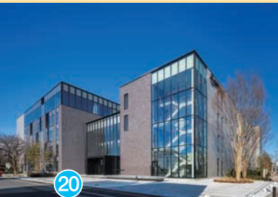
20 武蔵野音楽大学 Musashino Academia Musicae 武蔵野音乐大学