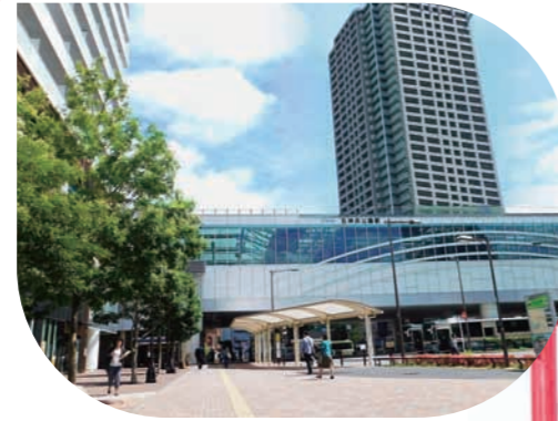
高架された駅と再開発ビル (石神井公園駅周辺) Elevated station and redeveloped building (around Shakuji-koen Station) 高架车站和再开发大楼(石神井公園駅周辺)