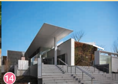
14 石神井公園ふるさと文化館 Nerima Shakuji-koen Furusato Museum 石神井公園故乡文化館