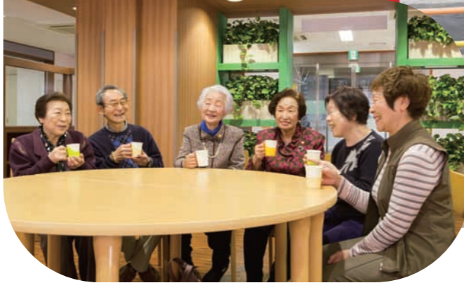
高齢者が気軽に集い、介護予防について学んだり、様々なイベントに参加できる「街かどケアカフェ」 The Machi-Kado Care Café, where senior citizens get together casually, learn about preventive care and participate in various events 老年人能随意聚会、学习介护预防、参加各种活动的“街かどケアカフェ”

健全介護保険施設等、架桥医疗和介护协作的居家疗养情报网。提供适合各位老年人的服务，支持老年人在住惯的地区生活。