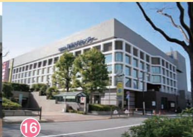
16 練馬文化センター Nerima Culture Center 练马文化中心