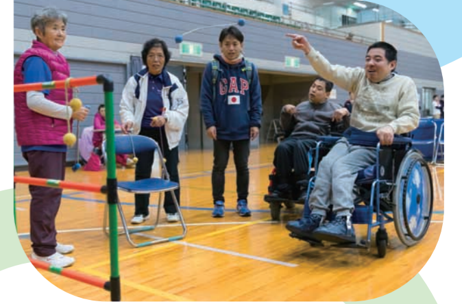
誰もが参加し楽しめる 「ユニバーサルスポーツフェスティバル」 Universal Sports Festival, where anyone, can participate and enjoy themselves 任何人都能愉快参与的“Universal Sports Festival”

Creating the Future of Nerima Together 大家一起培育未来的练马