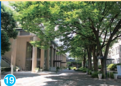
19 武蔵大学 Musashi University 武蔵大学