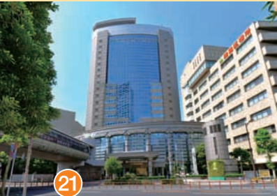
21 練馬区役所 Nerima City Office 练马区政府