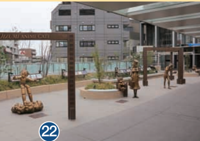
22 大泉アニメゲート Oizumi Anime Gate 大泉动画门