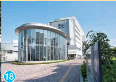
18 日本大学芸術学部 Nihon University College of Art 日本大学艺术学院