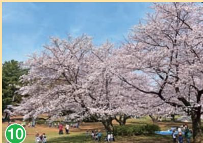
10 都立光が丘公園 Tokyo Metropolitan Hikarigaoka Park 都立光丘公園