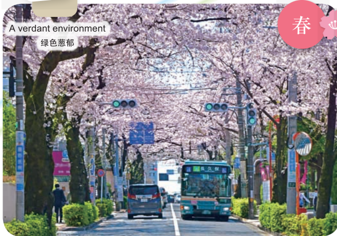
A verdant environment 绿色葱郁

Spots for relaxation where one can feel the changing seasons 可感受四季不同风景的区民休息场所