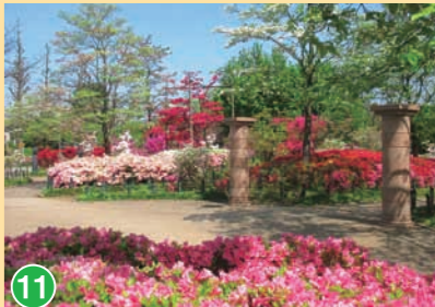
11 平成つつじ公園 Heisei Tsutsuji Park 平成杜鹃公園