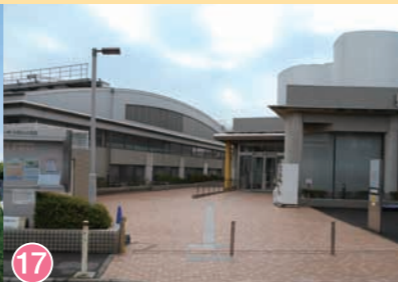
17 大泉学園町体育館 Oizumigakuencho Gymnasium 大泉学園町体育馆