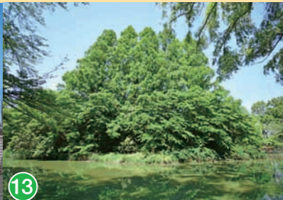
13 武蔵関公園 Musashiseki Park 武蔵关公園