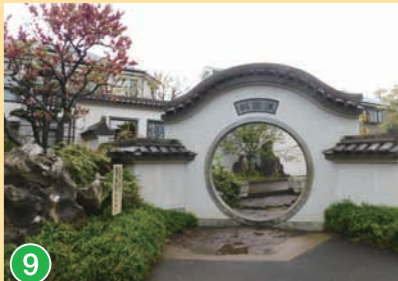
9 立野公園 Tateno Park 立野公園