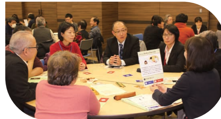
区民との協働から生まれた認知症対応研修プログラム「N-impro (ニンプロ)」を活用し、地域の見守り体制を強化

We will utilize the dementia-response training program created through collaborating with residents called N-impro, protect local communities and strengthen the system. 利用由与区民合作孕育的痴呆症应对研修计划“N-impro”，强化地区的照料体制。