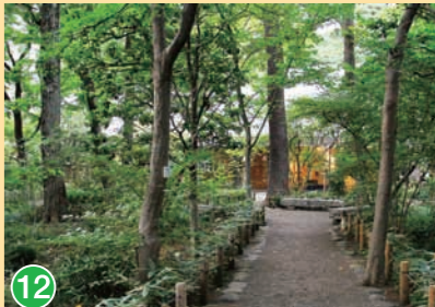
12 牧野記念庭園 Makino Memorial Garden 牧野記念庭園