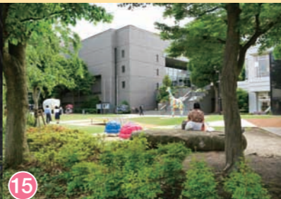
15 練馬区立美術館 Nerima Art Museum 练马区立美术馆