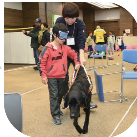
「みんなのUDパーク」でのアイメイト体験 Seeing-dog experience at Minna no UD Park 在“Minna no UD Park” 体验导盲犬

以实现谁都能安心生活、在生活中对未来寄予希望的城市为目标，进一步充实福祉和医疗服务。