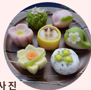
와가시 ※ 이미지 사진