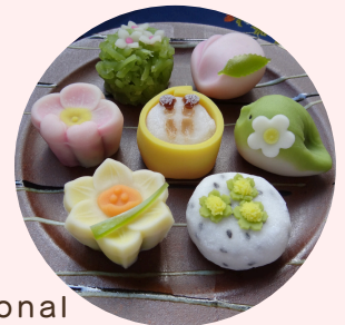
Wagashi-traditional Japanese sweets