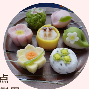
日式甜点 ※印象例图