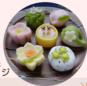
わがし 和菓子 いめーじ ※イメージ