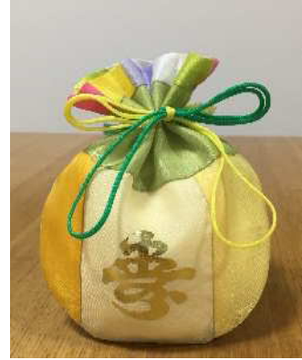
もらったお年玉 としだま を入れる福袋 ふくぶくろ

しろ ふうとう い わた こ 白い封筒に入れて渡します。子どもたちは、おじ いちゃんやおばあちゃん、親戚 しんせき からお年玉 としだま をもら って喜びます。大人 おとな たちは、その子どもたちの すがた み えがお 姿を見て笑顔になります。