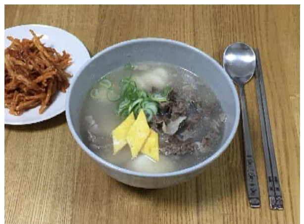
とっくく トックク