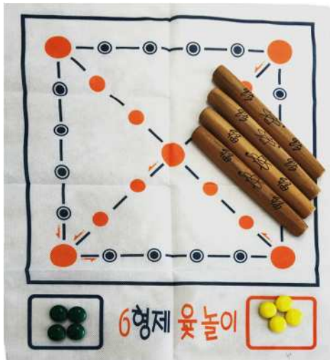
ゆんのり ユンノリ