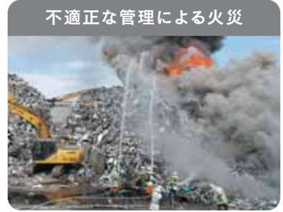
不適正な管理による火災

廃家電は電池やプラスチックを含むため、発火・延焼の危険性があり、不適正な管理による火災が発生しています。