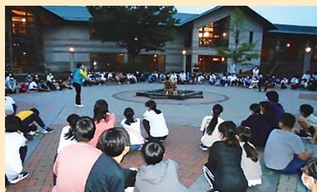
イングリッシュキャンプ (R4)