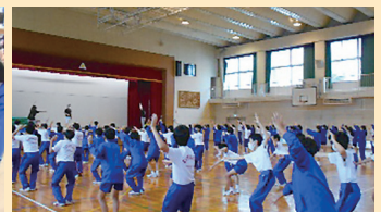
阿波踊り体験学習