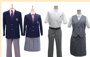
学校標準服 (冬・夏) 女子スラックスあり