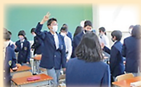
ピア・サポート (ひたすらジャンケン)