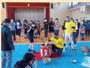
3月 おやじの会主催 餅つき