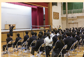
新入生歓迎会&amp;部活動紹介