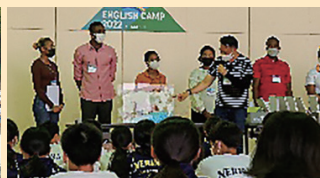
イングリッシュキャンプ