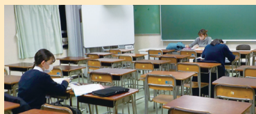
K中ゼミ ベーシック