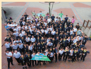
イングリッシュキャンプ