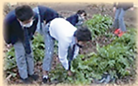
ボラバンク「大根とっちゃう?」