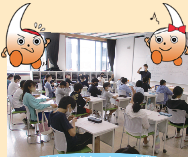
小中一貫教育 乗り入れ授業