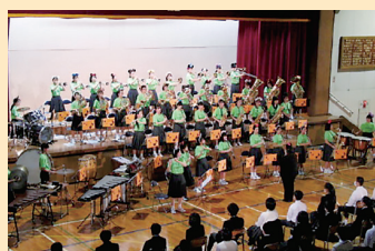
文化祭で演奏する吹奏楽部