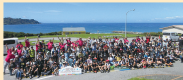
イングリッシュキャンプ