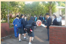
生徒会の挨拶キャンペーン