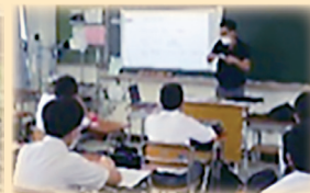
プロジェクト学習