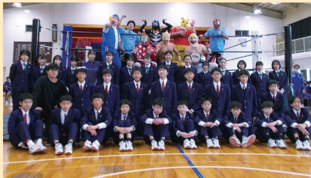
子どもを笑顔にするプロジェクトプロレス観戦