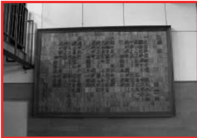
田柄第三小の校歌板