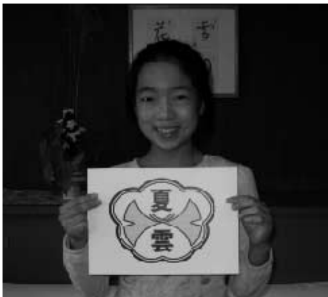
光が丘第五小校長室にて

私の作品が選ばれてびっくりしました。 いちょうの葉が重なり合うように、両校 が仲良く1つの学校になってほしいです。