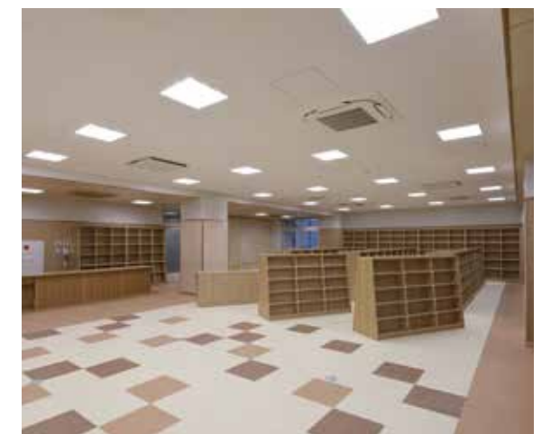
メディアセンター（図書室）

北側のお寺の景色に合わせ、木製の内装と木目調の家具を採用し、落ち着きのある空間としている。