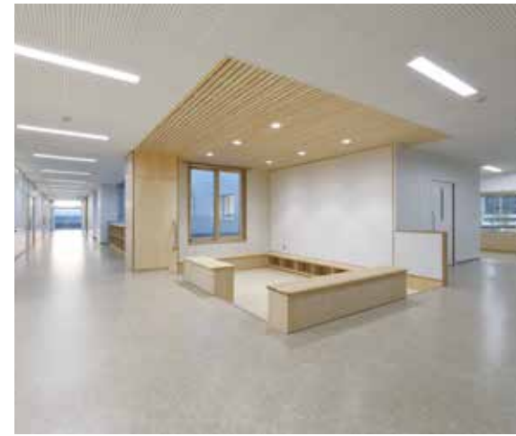
学年ラウンジ（低学年）

床の高さを一段下げ、落ち着いて座れる木製の棚等を設け、温かみのある空間としている。