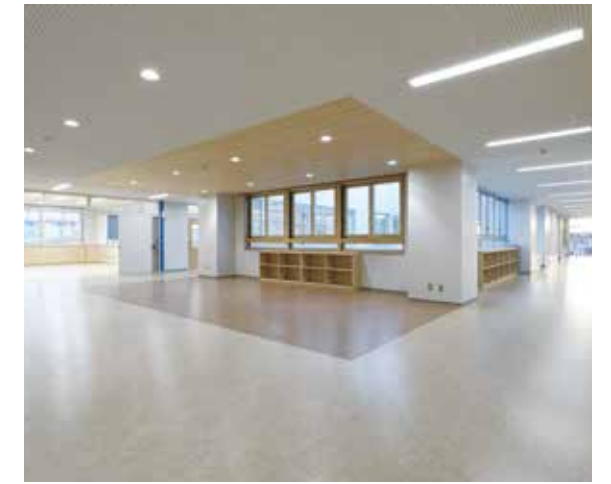
学年ラウンジ（中・高学年）

床の高さを一段下げ、落ち着いて座れる木製の棚等を設け、温かみのある空間としている。