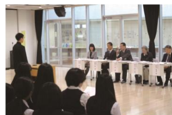
教育委員会と生徒・保護者の意見交換会