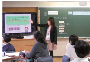
映像を使用した授業