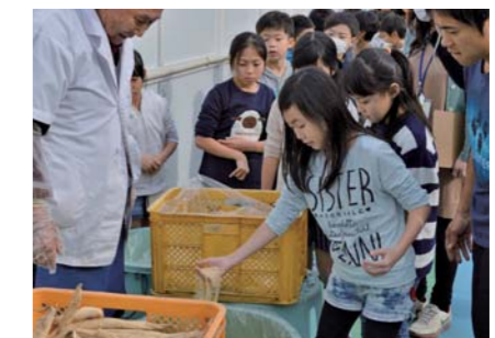
練馬大根を使ったたくあん作り