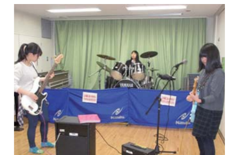
中高生タイムでのバンド練習