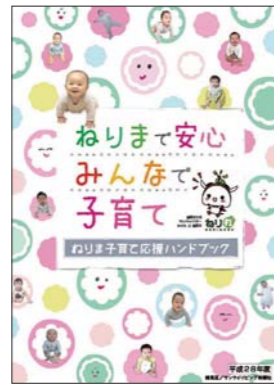
子育て情報誌 「ねりま子育て応援ハンドブック」