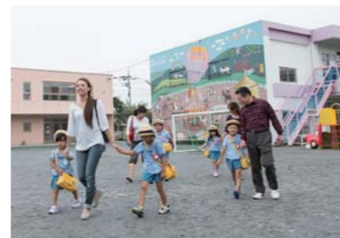
練馬こども園でのお迎えの様子