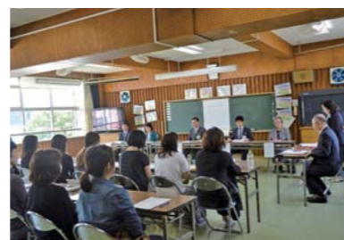
保護者と教育委員会の意見交換会