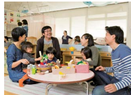
子育てのひろば「びよびよ」