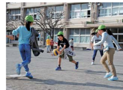
放課後校庭での外遊び