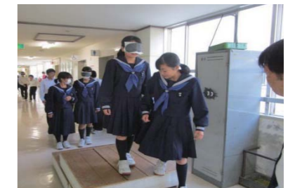
アイマスクと移動介助の体験