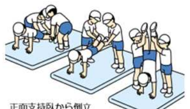
正面支持臥から倒立 〔2人で補助する場合〕 【学校体育実技指導資料第10集 器械運動指導の手引】