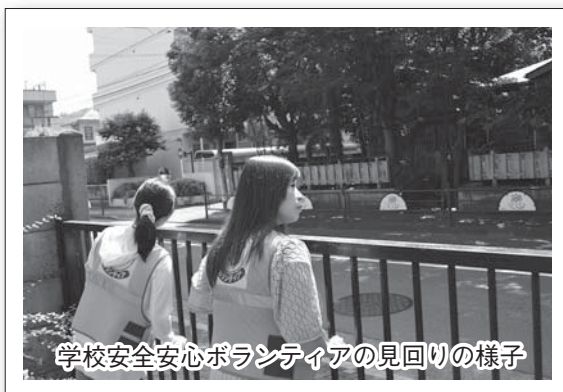
学校安全安心ボランティアの見回りの様子