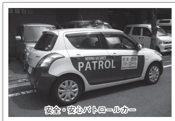
安全・安心パトロールカー