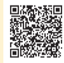
コンパス ～君に届けるこの一冊～