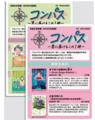
コンパス ～君に届けるこの一冊～

「よんでみようこんなほん」や「コンパス～君に届けるこの一冊～」は区立図書館ホームページでも紹介しています。