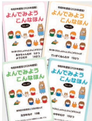
よんでみよう こんなほん

区立図書館では、みなさんが本を役立て楽しめる図書館づくりを行っています。紹介されているおすすめ本も置いていますので、お近くの図書館にお立ち寄りください。