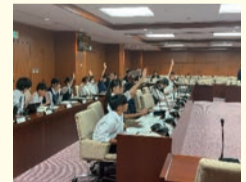
※令和7年度学習会の様子

子ども議員は区政や区議会、選挙の仕組みを学び、グループ討議や地域調査、意見交換会を経て発表内容をまとめます。