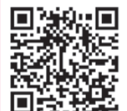
教育総務課 庶務係

教育だよりの紙面に対してはもちろん、各記事の詳細につきましてもご感想やご要望をお待ちしています。二次元コードからアクセスし、「教育だよりへのご感想・ご要望について」よりメールをお寄せください。いただいたご感想、ご要望は、次号以降の記事作成への参考とさせていただきます。