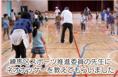
練馬区スポーツ推進委員の先生に ネオホッケーを教えてもらいました