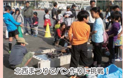
北西まつりでパン作り挑戦!