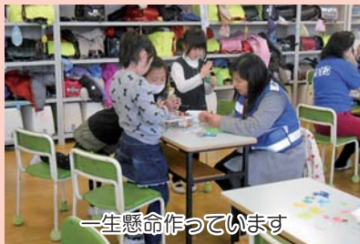
一生懸命作っています