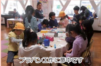
プラバン工作に夢中です

北町西小学校応援団なのはなひろばでは、毎月「工作の日」を開催しています。3月はプラバン工作をしました。子供たちは、スタッフに教えてもらいながら楽しく工作をしていました。なのはなひろばでは、「工作の日」のほかにも、体育館でスポーツ体験をしたり、出前児童館に参加したり、ひろばに来る子供たちが楽しめるような工夫をしています。