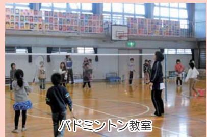
バドミントン教室