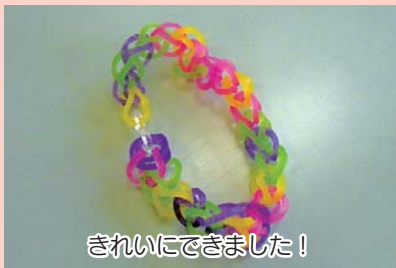
きれいにできました!

泉新小学校応援団「わくわくひろば」では平成27年2月18日（水）に「工作イベント」、2月27日（金）に「バドミントンDAY」を実施しました。「工作イベント」では、カラフルな輪ゴムを使ってアクセサリを作りました。コツを掴んだ子供たちは思い思いの作品を楽しそうに作っていました。「バドミントンDAY」では地域の大人の方々に、バドミントンを教えてもらいました。子供たちは元気いっぱい遊び、指導してくれた方々にお礼を言って終わりました。このように、ひろばは地域の方々に支えられて運営しています。