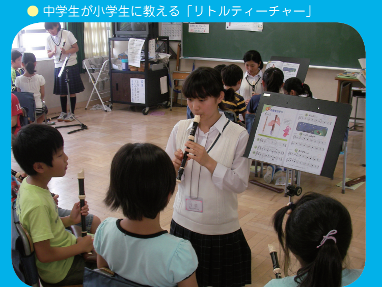
● 中学生が小学生に教える「リトルティーチャー」