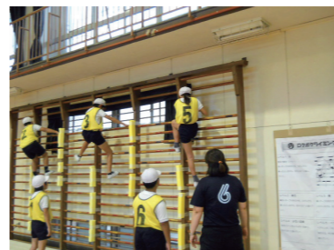
体育・芸術分科会授業