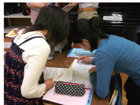
ノートを持ち寄って意見交換

旭町小で力を入れている「ノート指導」(課題や計画、取組、友人の良い考へやまとめ、感想を記す)を豊浜中でも活かすよう、継続的な「ノート指導」を小中合同で研究しています。小中で「身に付けさせたい力」を共有し、9年間で論理的に思考・判断・表現できる児童・生徒の育成を目指します。<算数・数学> 自分の解き方と友達の考へ方も書き、誤答の原因を解明するなど、ノート作りを意識して指導しています。<理科> 「ノート指導」を活かして、実験の授業では予想レポートを作成し、発表や討論を実施しています。