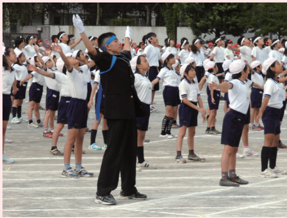
● 1～9 年生合同の運動会

入学式では、新 1 年生と新 7 年生が手をつないで一緒に入場して、4・9 年生が迎えます。6 年生と 9 年生の卒業式は一緒にいき、5・8 年生が送ります。運動会や桜祭(音楽会)は、1 年生から 9 年生まで一緒に行っています。5～9 年生の飯ごう炊さん、ランチルームでの交流給食など、異学年交流を経験することで低学年が上級生にあこがれ、上級生は下級生の面倒を見るようになるなど、幅広い人間関係が育ってきています。