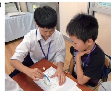
中学生の「ミニ先生」大活躍!