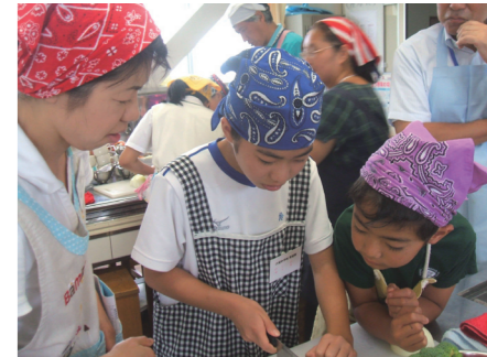
小中連携の親子料理教室

算数・数学の授業では、習熟の度合いに応じたクラス編成や小グループによる話し合い活動等を行っています。今年度から、中学校教員が小学校の算数授業に入る「乗り入れ授業」を始めました。『乗り入れ授業』で小・中学校の教員と一緒に授業研究を行うことにより、学力向上につなげます。