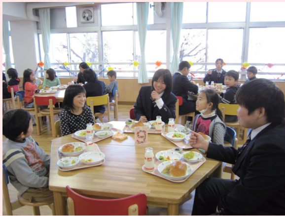
● 2 年生と 7 年生の交流給食