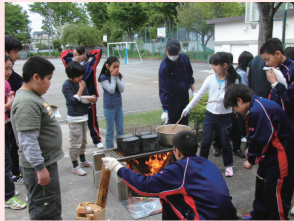
● 5～9 年生合同の飯ごう炊さん