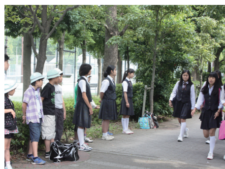
小中合同のあいさつ運動

交流活動の一つとして、小学校の児童と中学校の生活委員の生徒が「ふれあい月間」の活動で、共に通学路に立ち、あいさつ運動を行っています。秋のあいさつ運動では、地域の皆さんと一緒に取り組んでもらっています。