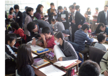
合同研究授業(算数)