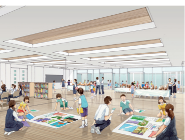
「小中連携教室」イメージ