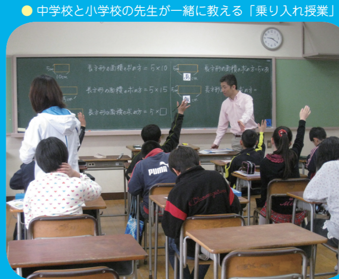
● 中学校と小学校の先生と一緒に教える「乗り入れ授業」