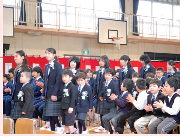
● 新 1 年生と新 7 年生の合同入学式

子供たちの発達段階に合わせて、1～4 年生を I 期、5～7 年生を II 期、8・9 年生を III 期として、それぞれの時期に応じた「学び」を進めています。