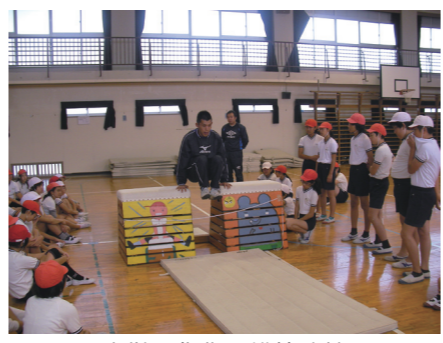
中学の先生の模範演技

よりスムーズな小・中学校の接続を目的として、平成17年度より、中学生が先生役になって小学生に教えるリトルティーチャーの授業を実施しています。小・中学校の教員が共同で指導案を作成し、事前・事後の指導も協力して行います。中学1年生と2年生で計2回、全員がリトルティーチャーを経験します。