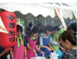
地区祭の模擬店小中教員合同参加