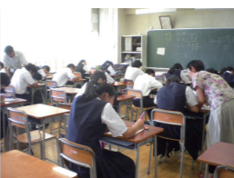
中学夏季補習で小学校教員の協力指導

教育目標、学校組織、生活時程、年間計画、PTA地域連携、学習規律、生活指導に配慮し、顔をあわせて率直に話す人間関係を大切に、小中一貫教育を進めています。