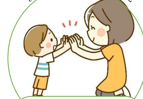
ファミサポホーム (保健相談所にて)