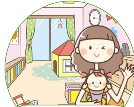
ひろば・児童館で