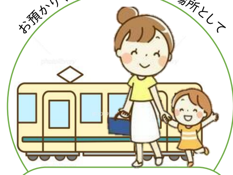
区外へ (隣接区市のみ)