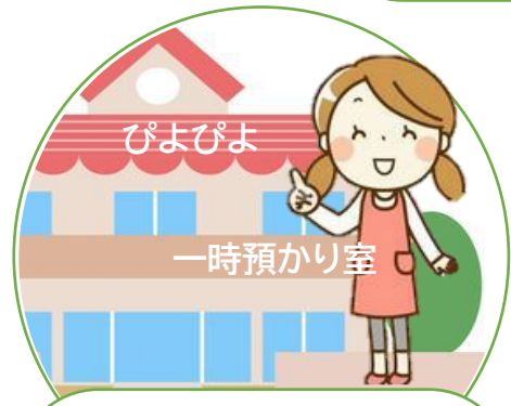
一時預かり室へ 送迎