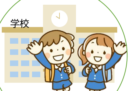
学校・学童クラブへ 送迎