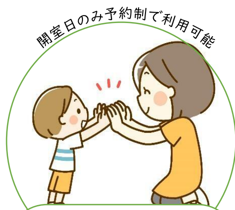
ファミサポホーム (保健相談所にて)