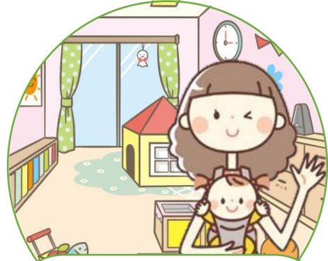
ひろば・児童館で