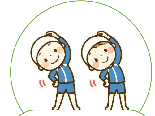
塾や習い事へ 送迎