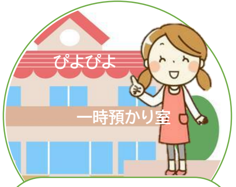
一時預かり室へ 送迎