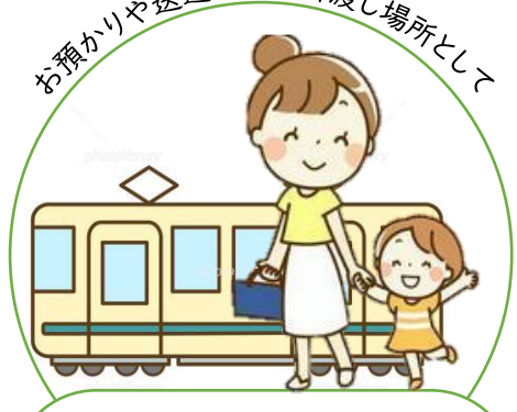
区外へ (隣接区市のみ)