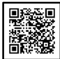
（保育課の窓口状況）

左記2次元コードより窓口の予約ができます。 また、当日の混雑状況や当月と翌月の混雑予想カレンダーも確認できます。