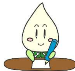
ねりまの生涯学習 マスコット「らぼ」

●この届出制度は、区の公共施設を利用予約するための「練馬区公共施設予約システム」の利用者登録とは異なりますので、ご注意ください。