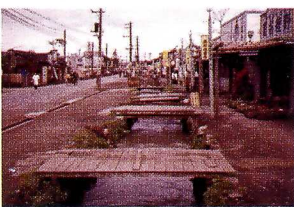
練馬駅前の商店街

昭和27年、暗渠化工事の最中に撮影された60コマのカラースライド。取水口から六義園まで、当時の風景が記録されています。