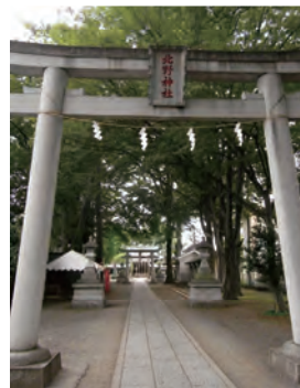
正面の参道は平坦です。

大泉学園駅の北口からほど近いところに北野神社があります。大泉街道から平坦に延びる参道が特徴ですが、大泉小学校の校庭から神社の背後を見ると、一段高い台地の縁に立っていることがわかります。このあたりは白子川の河岸段丘であることを物語っています。