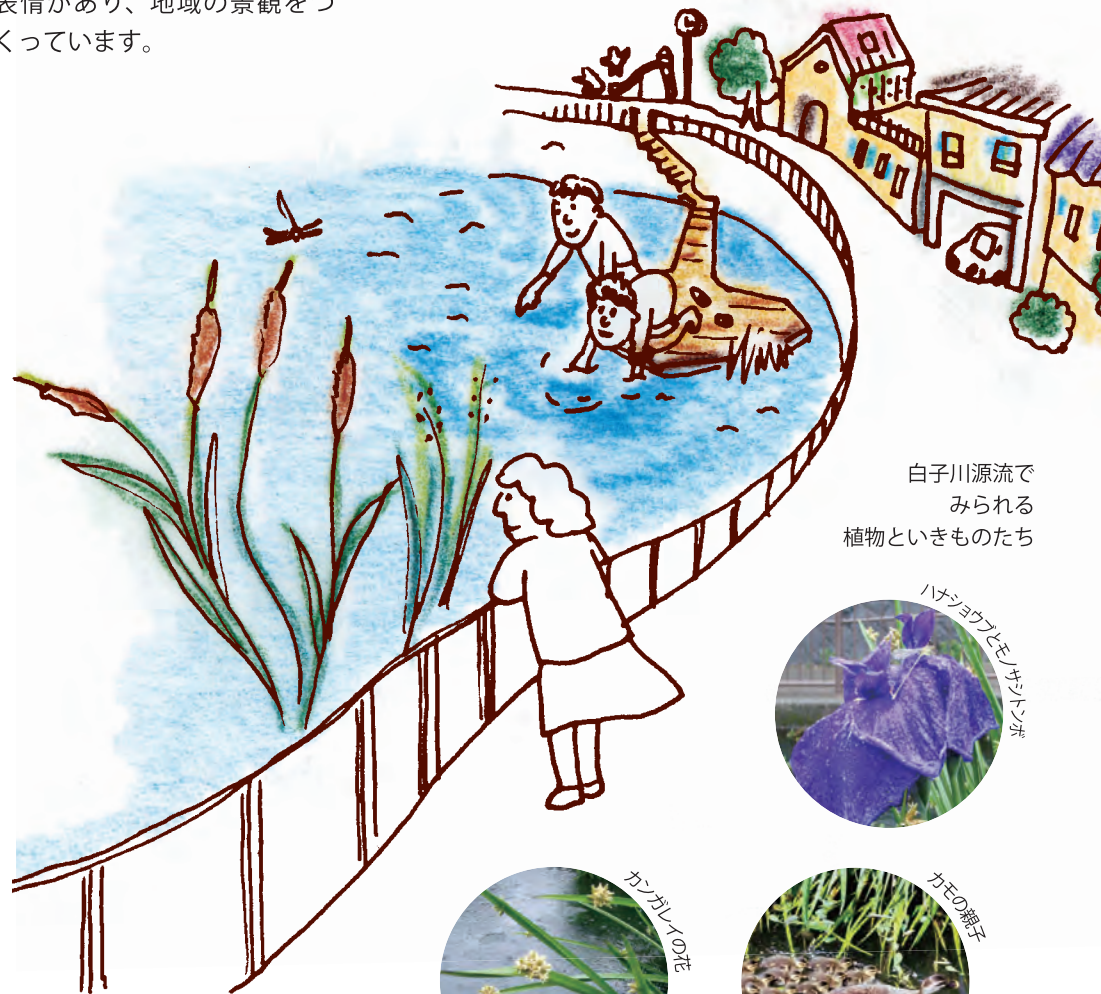
白子川源流で みられる 植物といきものたち

白子川の源流が流れる大泉井頭公園は、川の曲線に沿って造られた公園です。公園を取り囲むように住宅が立ち並び、水面の近くまで降りて水と親しむことができる特別な空間です。