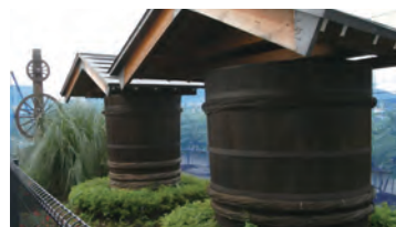
永井農園には、漬け物樽が飾られています。

漬け物樽や大泉第二小学校の石垣など、大泉の農風景を感じるしつらえや、小さな工夫があちこちにありますが、探しながら歩くのも楽しみのひとつです。