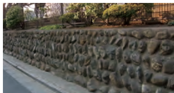
大泉二小の石垣は、練馬大根をたくあんにつけていた漬け物石で築かれています。