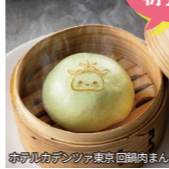
練馬区のデングア東京回廊内まん