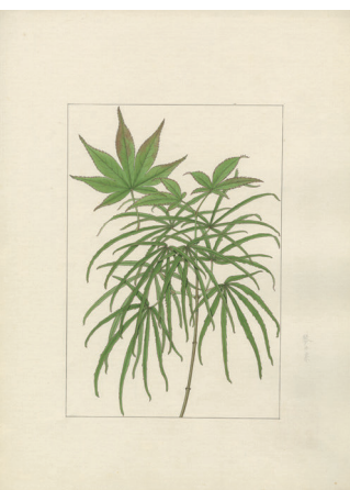
琴の糸 山田壽雄筆 1933 年