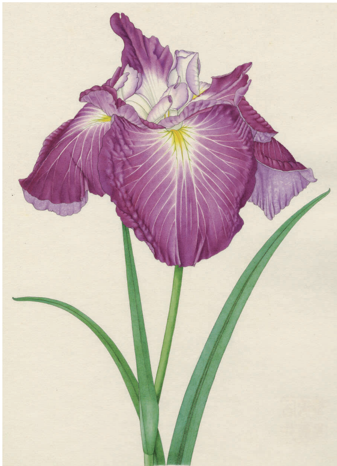
不知火 山田壽雄筆