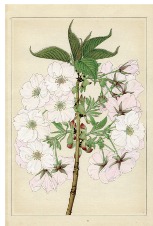
大提灯 山田壽雄筆 1933 年