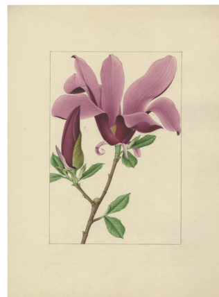
紫木蓮 山田壽雄筆 1933 年