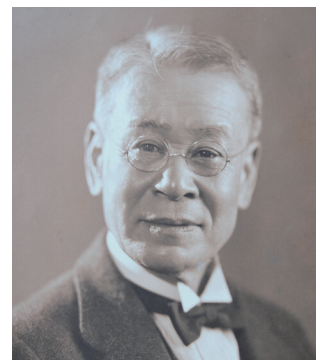
まきの とみ た ろう 牧野富太郎 略歴

文久2年(1862年)4月24日に高知の佐川村に生まれる。生涯に発見・命名した植物は1,500種類以上、収集した標本は約40万枚、研究のために収集した書籍は約4万5千冊にのぼる。大正15年(1926年)に渋谷から北豊島郡大泉村(現練馬区立牧野記念庭園の所在地)に移り住み、昭和32年(1957年)に満94歳で没するまでの約30年をこの地で過ごした。