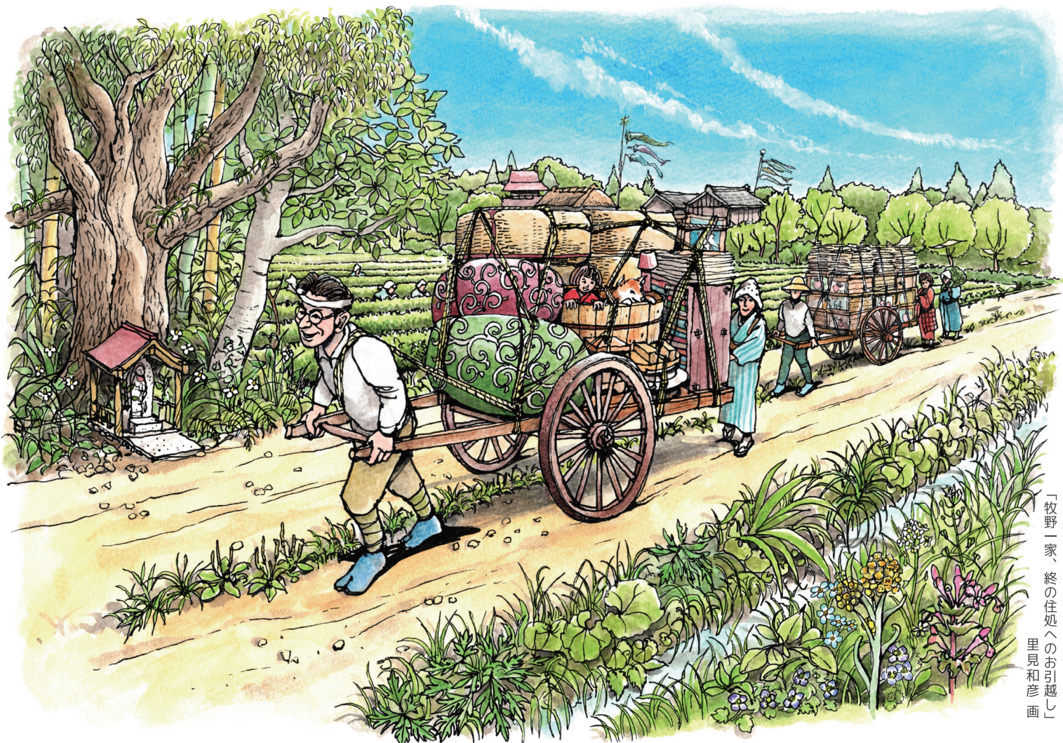
「牧野一家、終の住処へのお引越」 里見和彦画