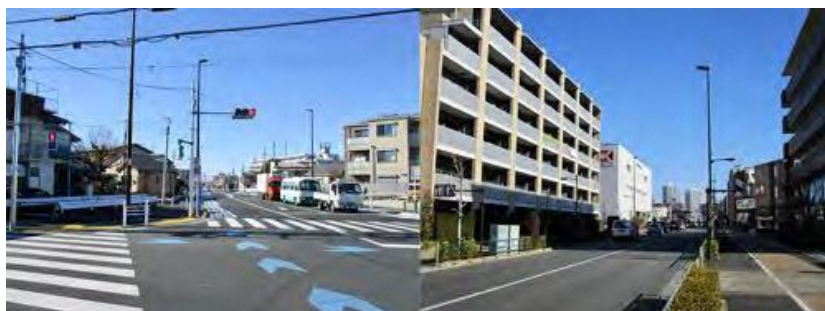
笹目通りから大泉町二丁目まで開通している補助230号線

乗田「これにより、課題解決や今後の進め方などについて、都庁内で検討が進められています。練馬区も連携して協議をしていくことになります」