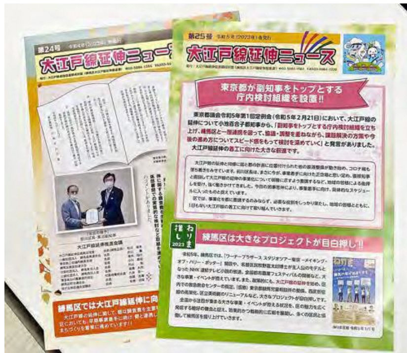
大江戸線延伸ニュース