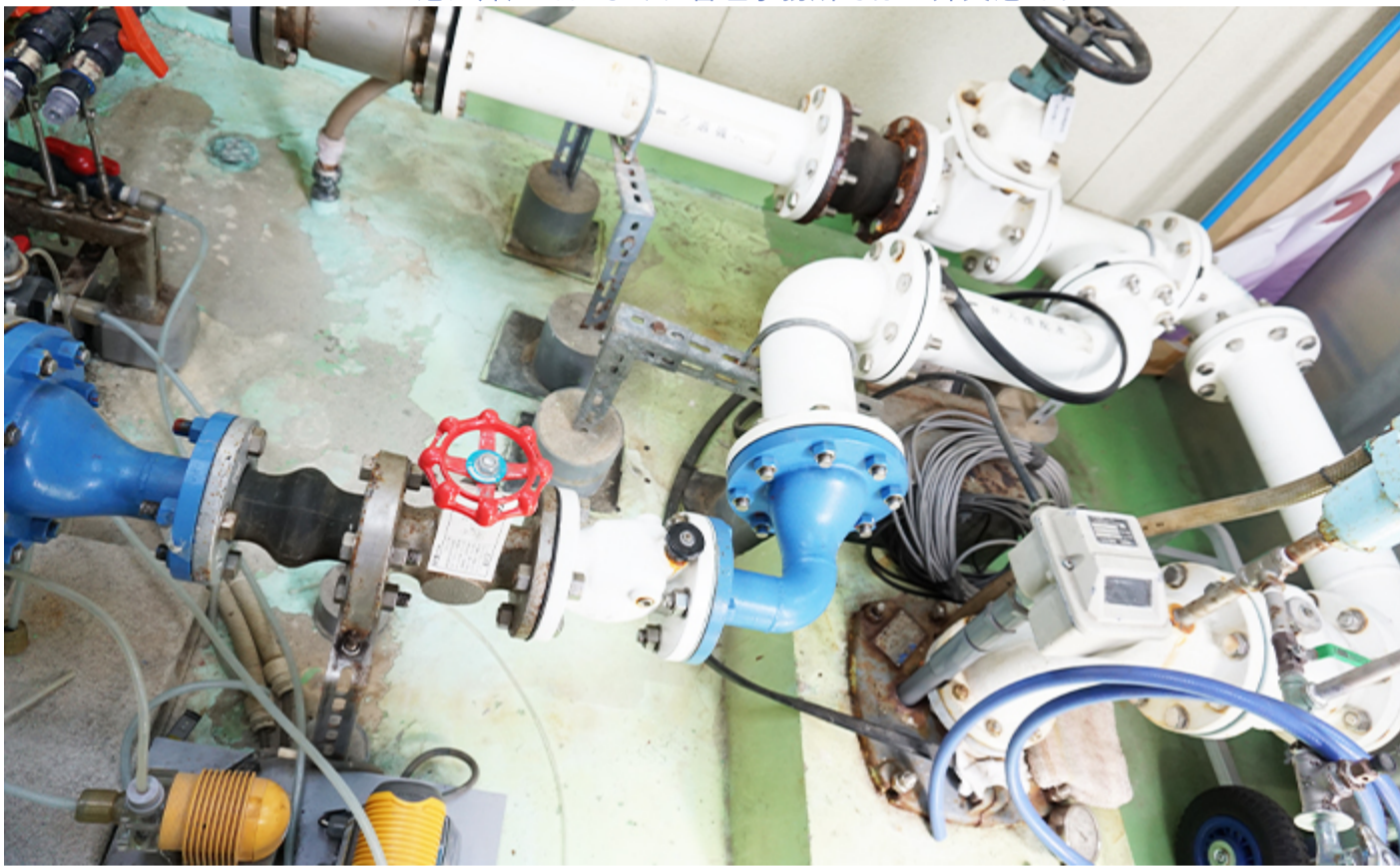
こちらが3号井戸、写真右下側の薄緑色の コンクリート面下に232mの深さの井戸があります

今から約30年前の1989年当時に、ある大学で、世界で一番美味しい水と言われていたカナダのケベックという場所の水や国内各地の水とこの水を、ある先生が開発した測定法を用いて、その美味しさを比較しました。その結果、この水はケベックの水に匹敵する水であることがわかりました。カナダが1番であれば、ここは2番目ではないかと（笑）。」