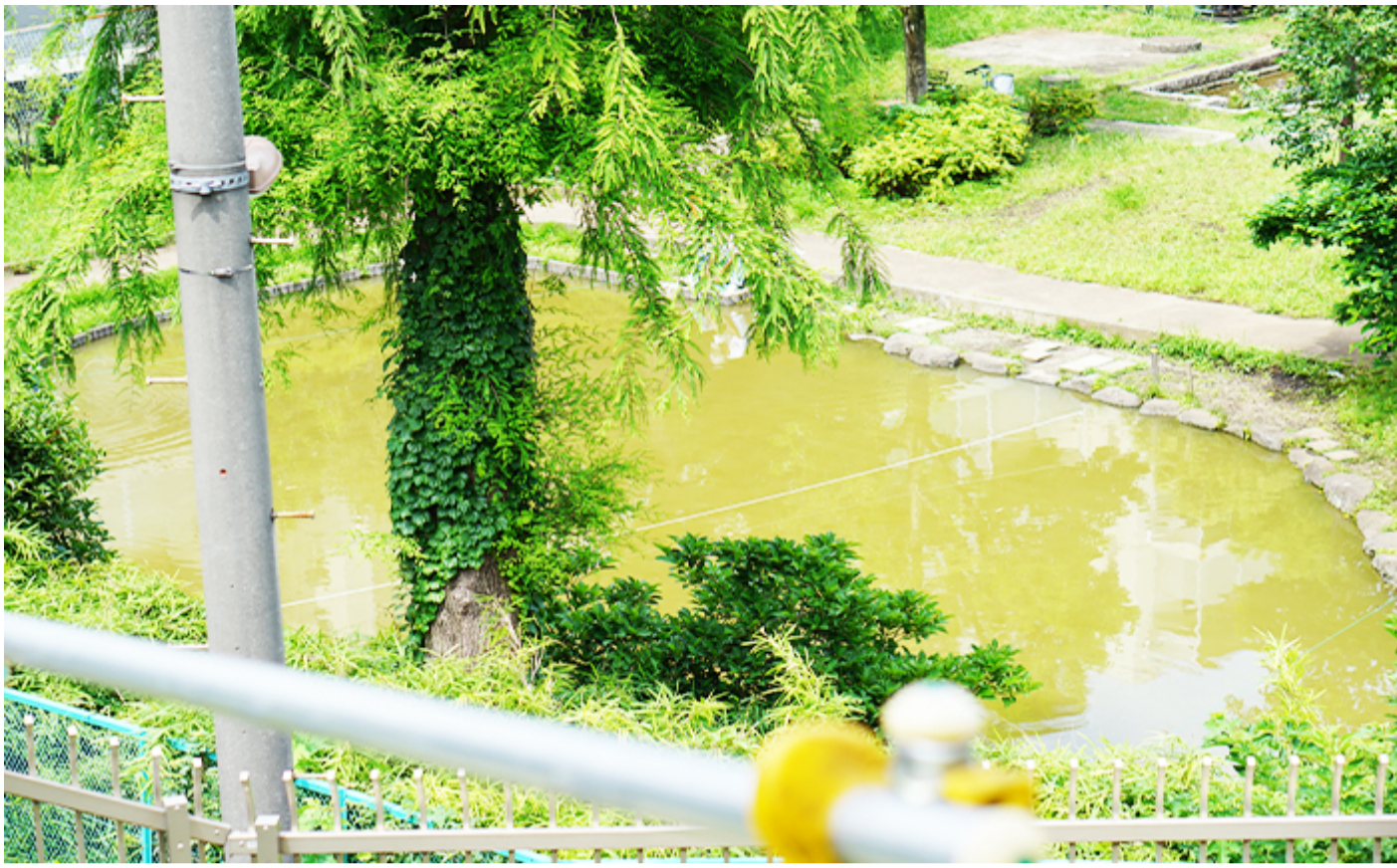
2号井戸は、屋外の離れにあります！ ※この池は井戸ではなく、管理事務所そばの弁天池です