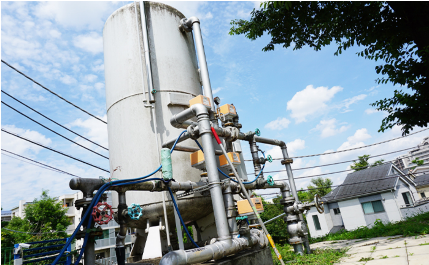
迫力がありますが、これはマンガンろ過装置で、井戸水を吸うポンプではないです

では、この井戸はそれらの影響を受けないのか？という点は気になると思います。結論を言えば、影響は限りなく低いと考えます。この1号井戸は、当初おおよそ350世帯くらいに水を供給していたのですが、夏場になると水の消費量が上がって、足りなくなることもあったようです。そこで1968年（昭和43年）に2号井戸ができます。この2号井戸は、現在でも稼働しています。ちなみに、1号井戸はもうありません。この2号井戸は、125mの深さまで掘っていき、水源は、奥多摩や秩父の山岳地帯の雨が地面に染み込んでいき、地下水脈となっています。土や砂の質にもよりますが、125mまで染み込むには、やはり時間がかかります。コーヒーなどでイメージされると分かり易いですが、汚れた不純物などは、何層にもわたる自然の地層のフィルターで、綺麗にろ過されます。