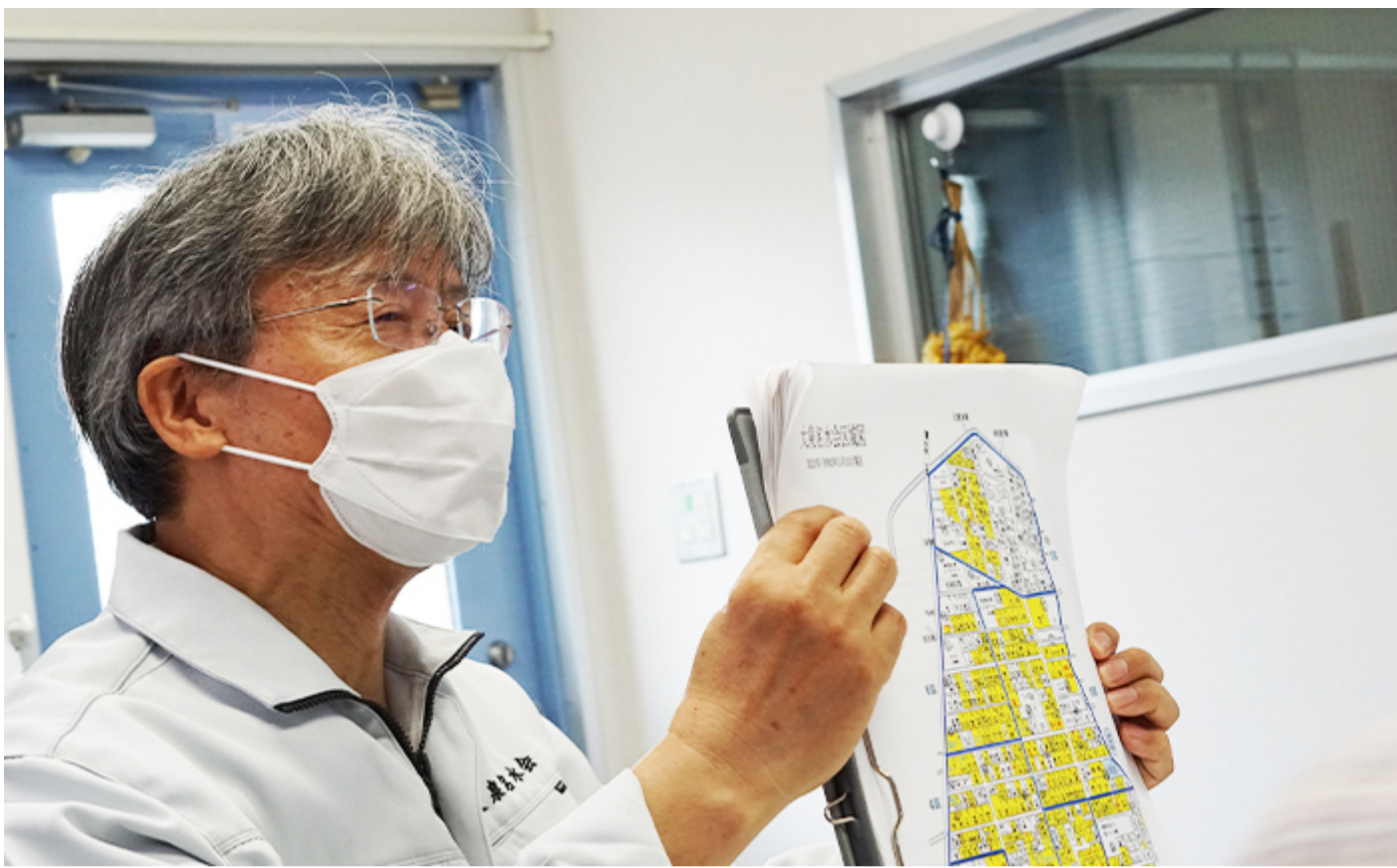
東大泉3丁目の地図を片手に説明、 ここから地域の会員宅に水が送られる

供給エリアは、実は、東大泉3丁目の一部を除くエリアだけなんですよ。 ですので、大泉名水会の水を日常の生活水として利用したいと希望されるなら、 引っ越されて来るしか方法がないのです。 ただ、名水会の事務所の前にはいつでも朝7時～夕方6時まで、ご自分で用意された ペットボトルや水筒などに汲んでご家庭に持ち帰ることのできる給水スタンドがあり、 こちらをご利用頂けるようになっております。 先の通り、維持管理のための費用が掛かりますので、金額は自由ですが、 お気持ち程度の金額をいただければと思っています」