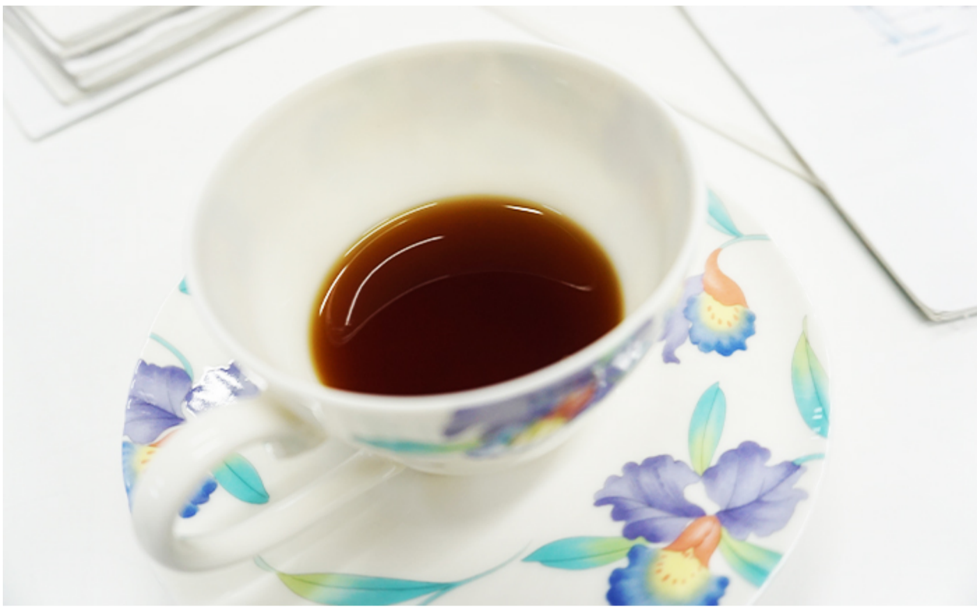
特別に入れていただいたコーヒー、 確かにスルリと喉を通る気がします！

ただ“美味しさ”というのは、飲んでみた時の感覚が大きいですから、 夏の暑い時なら、当然、冷たい水が美味しいですし、 飲んだ後の喉越しのまろやかさはこの水の特徴、と言われますが、 私たちは日常的に飲んでいきますから、明確な違いがもはやわからなくなってきています（笑）」