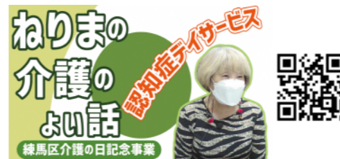
1. 認知症サービス ティ・サービス太陽

ミドリさんの物語 認知症とともに歩む Take it easy with Dementia