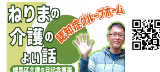
2. 認知症グループホーム ミニケアホームきみさんち